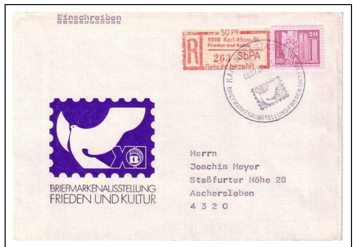
Abb. 10.3 Ausstellungsumschlag „Frieden und Kultur“