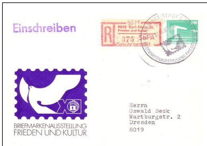
Abb. 10.1 Ausstellungspostkarte „Frieden und Kultur“

1) Diese Auflage stammt aus dem Export und war zur Zeit der Ausstellung nur als Banderolenverschußmarke bekannt geworden. Eine Verwendung auf Belegen dürfte deshalb erst nach Abschluß der Briefausstellung möglich gewesen sein.