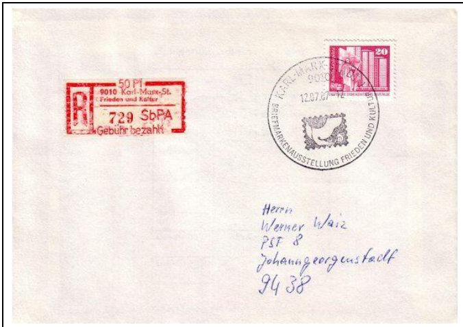
Abb. 10.5 Umschläge und Karten mit Ausstellungssonderstempel