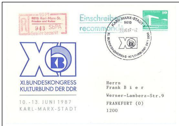
Abb. 10.2 Postkarte „XI. Bundeskongreß“