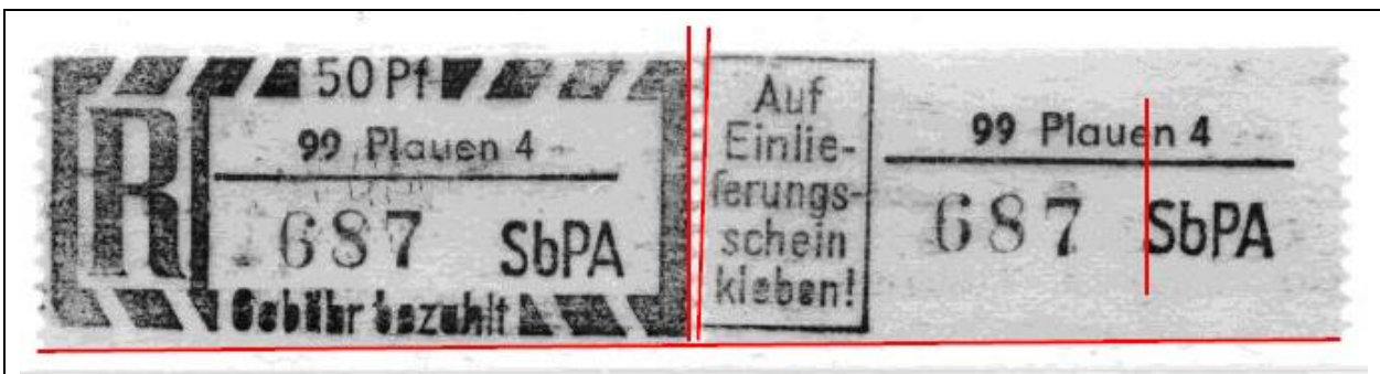
Auflage (2) „A“ in SbPA im DLT sauber gedruckt – winziges „Strichchen“ oder „Bogen“ als KN-Fragment im DLT – unten immer schmäler geschnitten