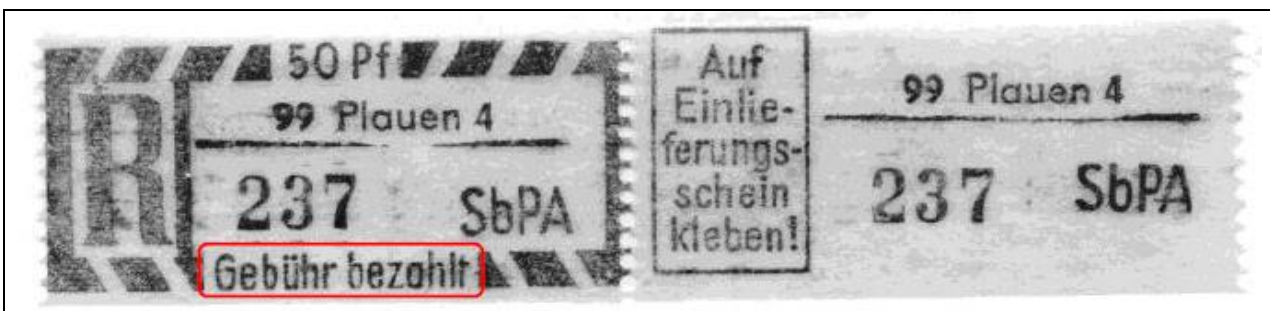
Auflage (3) „A“ in SbPA im DLT & „Gebühr bezahlt“ sauber gedruckt