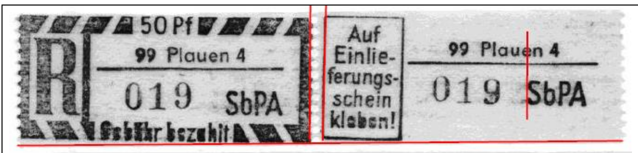
Auflage (5) ähnlich (1) Abstand rechte RL zum Hwk 1,9 mm - „A“ in SbPA im DLT sauber gedruckt – ohne KN-Fragment im DLT – unten schmaler geschnitten